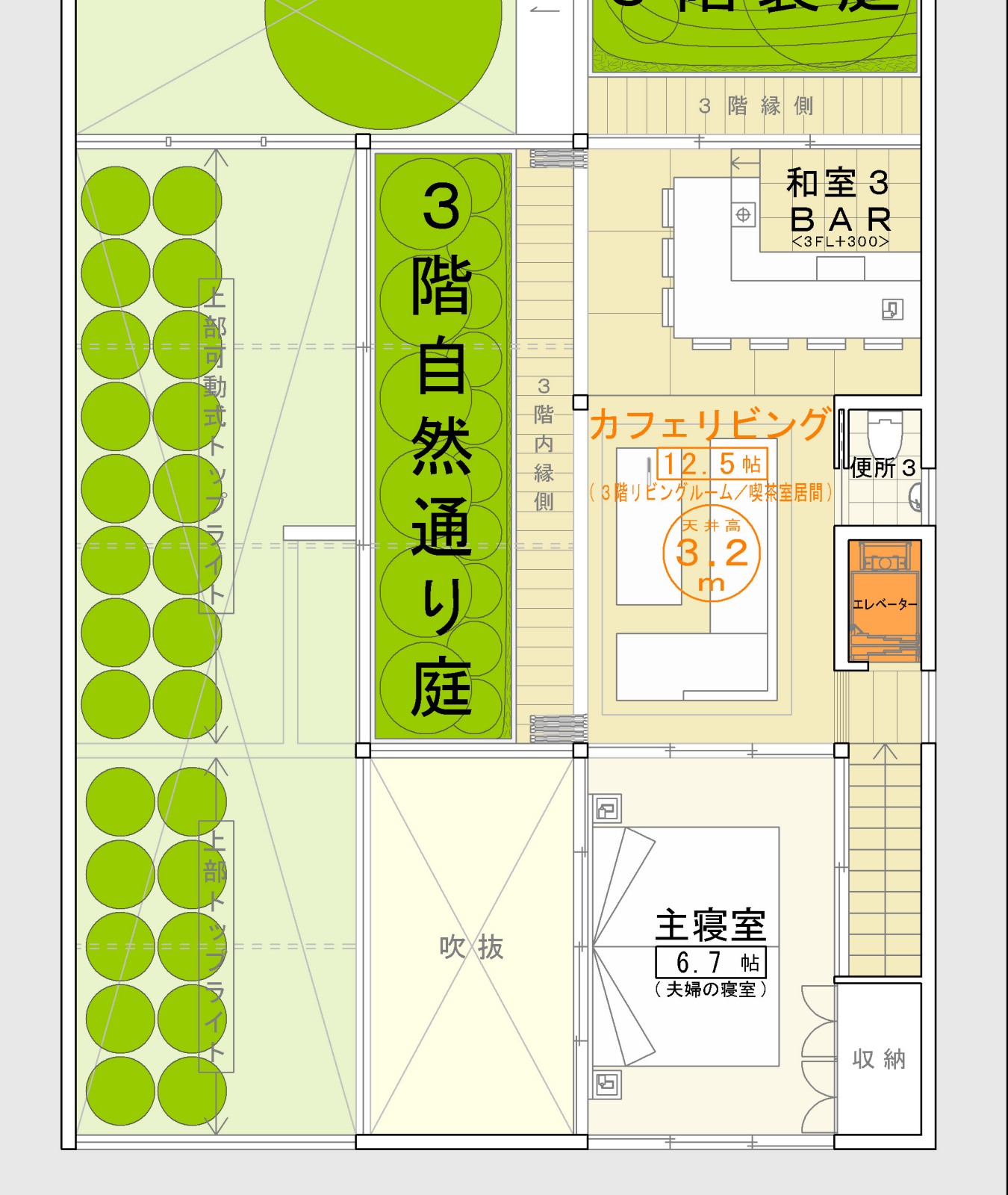
1階1階を真上から見る 2階2階を真上から見る 3階3階を真上から見る