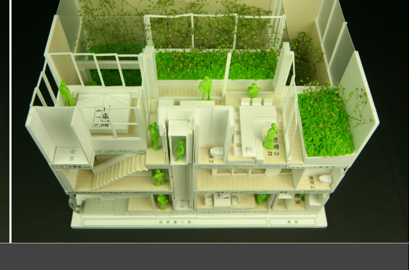
外観 断面方向から見る